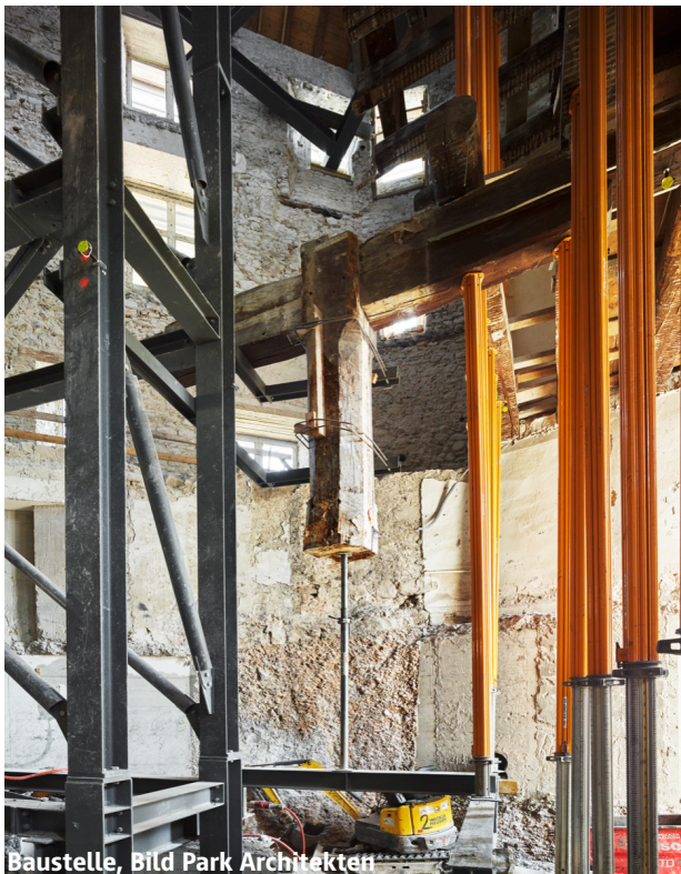
Baustelle, Bild Park Architekten