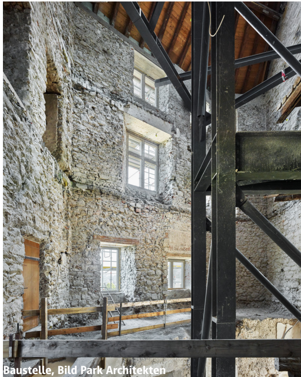
Baustelle, Bild Park Architekten

Besondere Ausrüstung notwendig: Bringen Sie Ihren Helm und festes Schuhwerk (Wanderschuhe) mit.