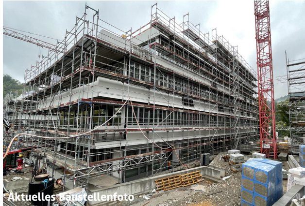
Römerstrasse 36a - 36g | Treffpunkt